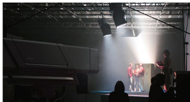
34 KNOW-HOW Theodor Scheimpflug hätte seine Freude an den Tilt-Shift-Möglichkeiten des digitalen Zeitalters gehabt.