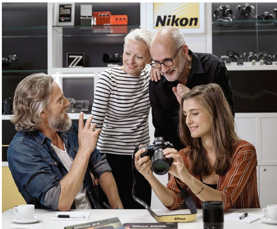
In den Präsenzveranstaltungen der Nikon School werden die Teilnehmer von erfahrenen Trainer geschult.

Webinare | Für Onlinenutzer bietet die Canon Academy eine Vielzahl von Webinaren an. Darin präsentiert das Canon-Academy-Team aktuelle Themen und Produkte. Teilnehmer lernen spannende Projekte von Fotografen und Videofilmmern kennen und erfahren die Meinung der Canon-Experten zu Technik und Ausrüstung. Bei den Canon-Academy-Webinaren können Interessenten live dabei sein und Fragen stellen oder die Webinare später als Video anschauen. Einige der Webinare werden mit Partnern veranstaltet, zum Beispiel Datacolor. Thematisch decken die Webinare das gesamte Spektrum des Workflows ab. So geht es zum Beispiel auch hier um Monitor- und Kamerakalibrierung oder Druckerprofilie-