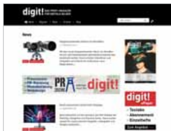
Übersicht zwischen den Beiträgen max 1.050 px x max 270 px