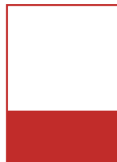
1/3 Seite quer A 210 x 109 mm S 189 x 90 mm Preis: 1.050 Euro*