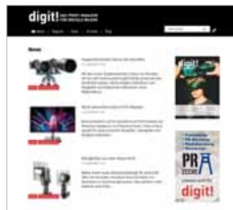
Sidebar max 330 px x max 650 px