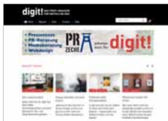
Homepage über dem Content max 1.400 px x max 350 px