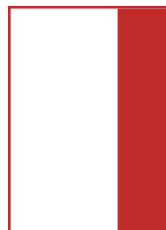
1/3 Seite hoch A 70 x 297 mm S 60 x 270 mm Preis: 1.050 Euro*