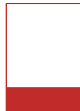
1/4 Seite quer A 210 x 84 mm S 189 x 67 mm Preis: 800 Euro*

# Angebote für Sonderformate erstellen wir gerne auf Anfrage # Mediaagenturen während wir eine Mittlerprovision in Höhe von 15 % des Buchungsvolumens. # Staffella sind ab der zweiten Buchung möglich.