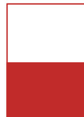
1/2 Seite quer A 210 x 148 mm S 189 x 135 mm Preis: 1.600 Euro*