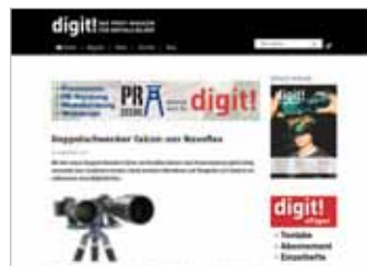
Einzelne Posts über den Beiträgen max 1.050 px x max 270 px