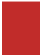
2/1 Seite A 420 x 297 mm S 398 x 270 mm Preis: 5.500 Euro*